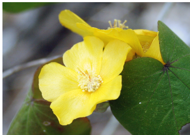
Bakeridesia gaumeri .

Otra de las enfermedades infecciosas que nunca ha dejado de ser una de las causas principales de morbilidad y mortalidad en todo el mundo es la tuberculosis. En 1990 se estimó que esta enfermedad era responsable de una de cada cuatro muertes a nivel mundial. En 1992 casi un tercio de la población mundial era hospedero de Mycobacterium tuberculosis y se encontraba en riesgo de desarrollar la enfermedad (Rook y Hernández-Pando, 1996). Y en 1995 el número de nuevos casos de tuberculosis en el mundo era mayor de 8 millones al año, calculándose que más de 3 millones de personas morirían cada año de esta enfermedad. La OMS pronosticó que a partir del año 2005 la tuberculosis causaría la muerte de 4 millones de personas anualmente. Esta enfermedad es especialmente severa en individuos infectados con VIH, y la importancia de encontrar nuevos productos activos contra M. tuberculosis radica en el hecho de que últimamente han surgido cepas resistentes al Isoniazid ® , medicamento de elección para su tratamiento (Deretic y otros, 1996). En México se reporta que desde 1990 se infectan de tuberculosis de 13 a 15 mil personas por año. Estadísticas locales en Yucatán señalan un pro-