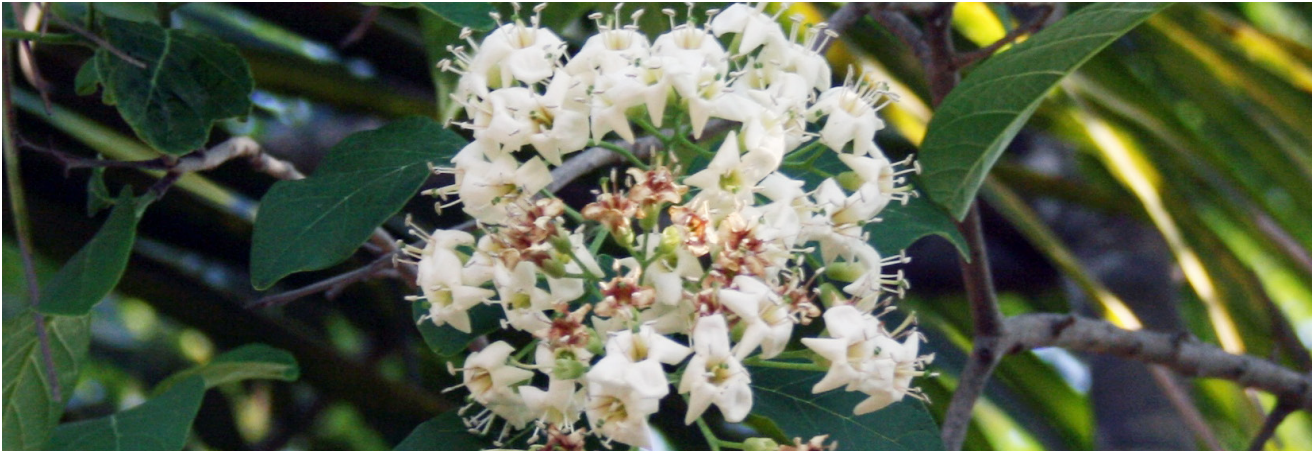
Bourreria pulchra .

Con base en los resultados obtenidos, se seleccionaron 15 extractos de especies vegetales que mostraron la presencia de al menos un tipo de actividad biológica (p. ej.: antifúngica, antiprotozoaria, citotóxica, antituberculosa y anti-VIH) (Cuadro 2), para ser evaluados en cuanto a su potencial para el desarrollo de un fitofármaco comercial y/o para ser sometidos a un proceso biodirigido de purificación que permita el aislamiento y la identificación de los metabolitos responsables de la actividad detectada.