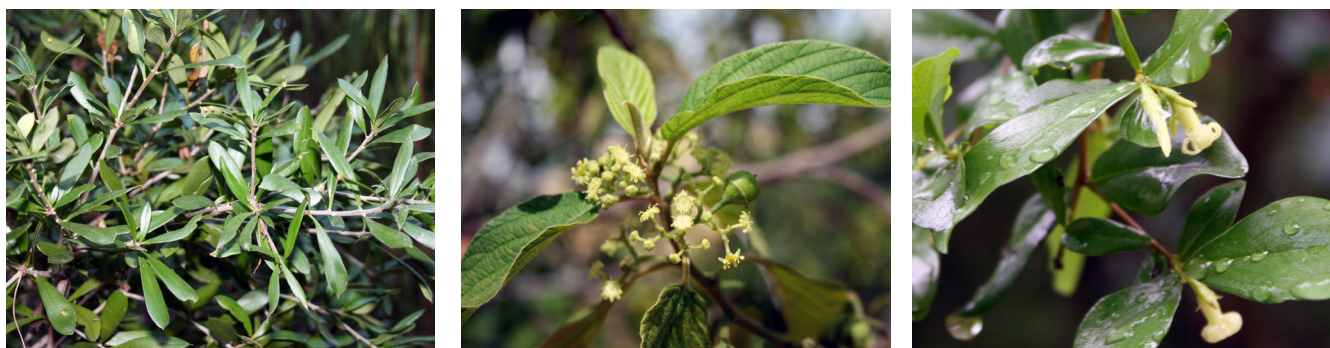
Bonellia flammea / Colubrina greggi / Diospyros anisandra .

Aun cuando esta enfermedad es causada por cuatro especies de Plasmodium ( P. falciparum , P. vivax , P. ovale y P. malariae ), la mayoría de los casos ocurren como consecuencia de una infección por parásitos de P. falciparum transmitidos por el vector Aedes aegypti . La reemergencia de la malaria como problema de salud pública está ligada a la aparición de cepas de P. falciparum resistentes a la quinina y otras drogas de uso común como la cloroquina y la pirimetamina (Kayser y otros, 2000). En la actualidad, la malaria cobra 7000 vidas al día y es reconocida como una de las principales amenazas del planeta. Es la única de las enfermedades “huérfanas” que ha recibido atención, dada su importancia estratégica, por parte de los países desarrollados.